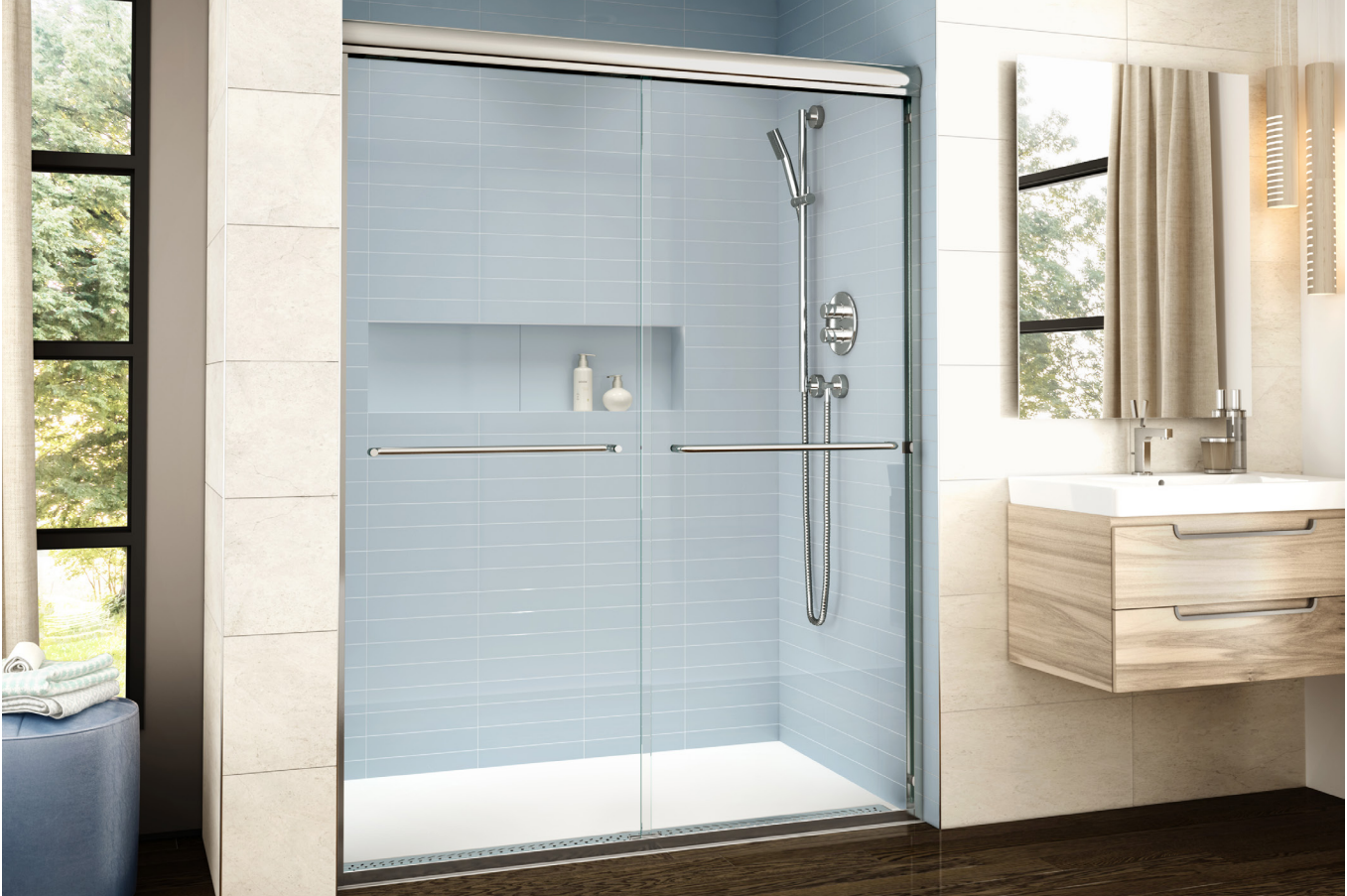
Model shown / Modèle présenté : Cordoba In-Line Bypass Plus / Cordoba en alcôve bidirectionnel plus (CL161-11-40)

Semi-frameless in-line sliding shower doors / Portes de douche coulissantes avec cadre partiel